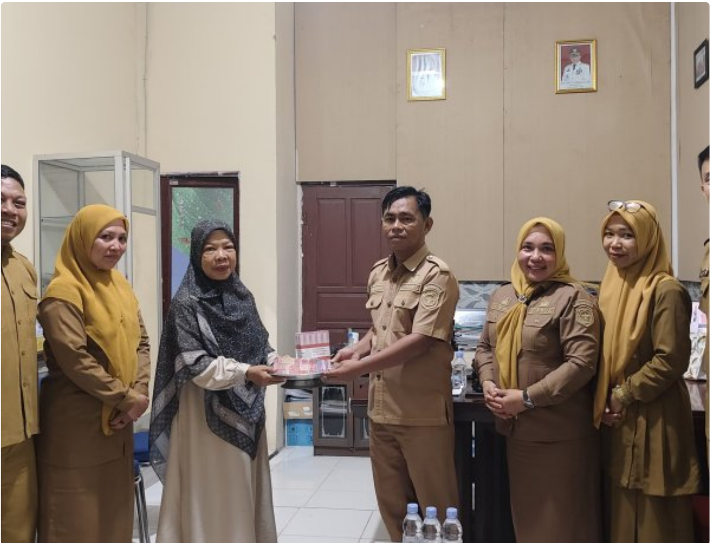
Ketua Umum PGRI Mamuju Tengah Menyerahkan Rp.122.680.500.- Untuk Korban Bencana Aceh dan Sumatra